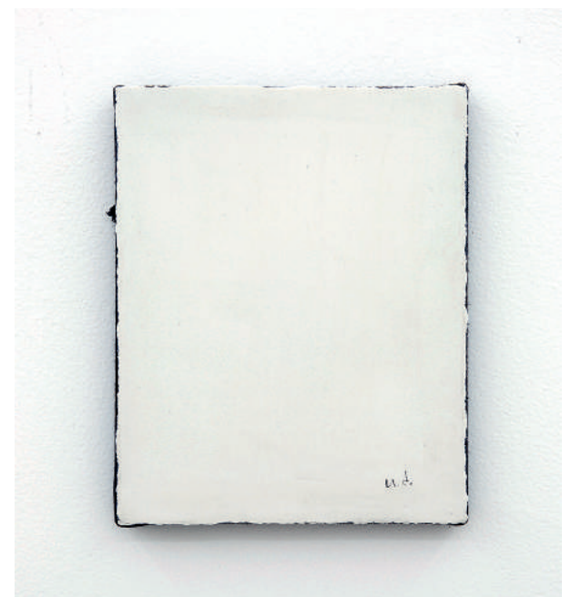
↑ Mario García Torres N.D. , n.d. Grafito sobre plastilina sobre lienzo 25 x 20 x 4 cm

SH5 l@josegarcia.mx www.josegarcia.mx CIUDAD DE MÉXICO