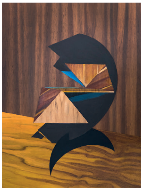
↑ Hulda Guzmán Sympathetic shapes , 2017 Acrílico sobre plywood de 3/8 78,5 x 58,5 cm

SH2 machete@macheteart.com www.macheteart.com CIUDAD DE MÉXICO