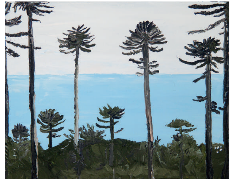
↑ Christian Vinck Escapada al Sur (Valpo, Quillota) VI , 2015 Óleo sobre lienzo 27 x 34 cm

SH9 info@galerialeme.com www.galerialeme.com SAN PABLO